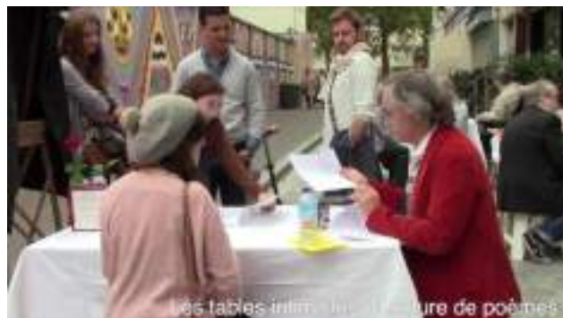
Table de lecture intimiste