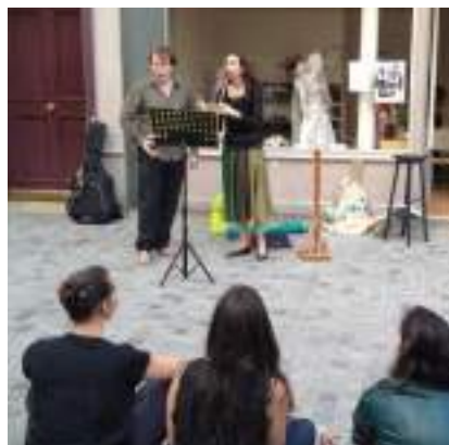
Poèmes en musique