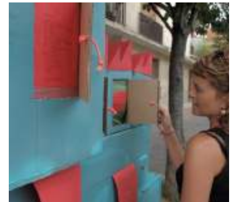
Poèmes à découvrir