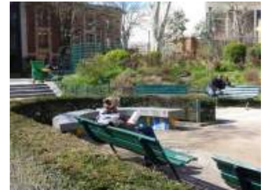
Square Alban Satragne