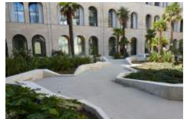
Jardin Cour Saint-Lazare