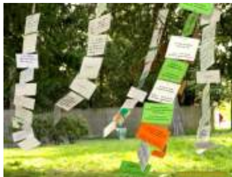
Poèmes au vent